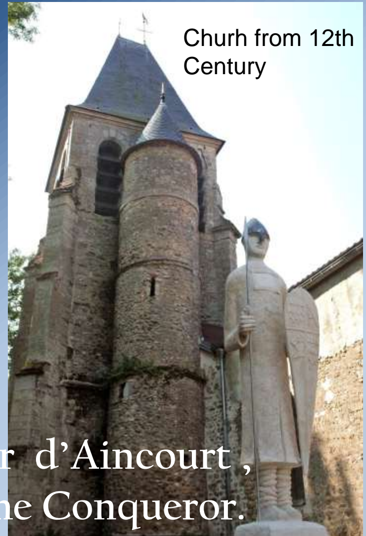
Church from 12th Century

Welcome to Aincourt Owned in 1066 by Gauthier d'Aincourt, companion of Guillaume The Conqueror.