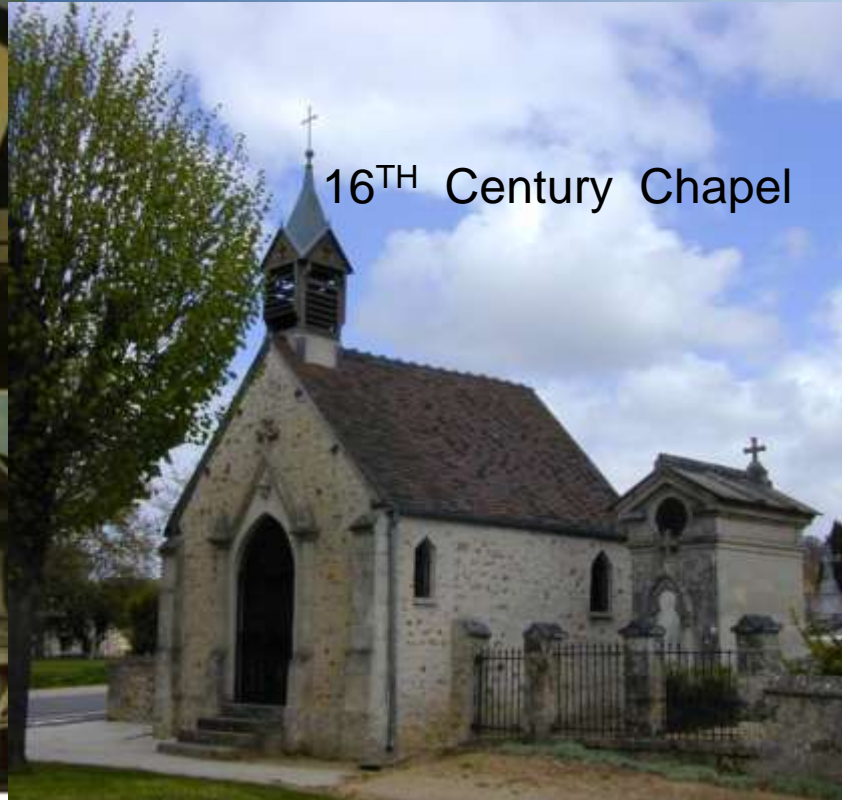
16 TH Century Chapel